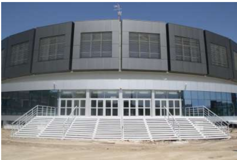
Спортски центар "ЧАИР"

О развијености система образовања најбоље говори статистика: око 50.000 ученика у 32 основне и 21-ој средњој школи и преко 27 хиљада студената Универзитета.