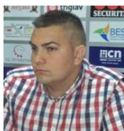
Председник студентског парламента

Седиште студентског парламента је у приземљу зграде Факултета.